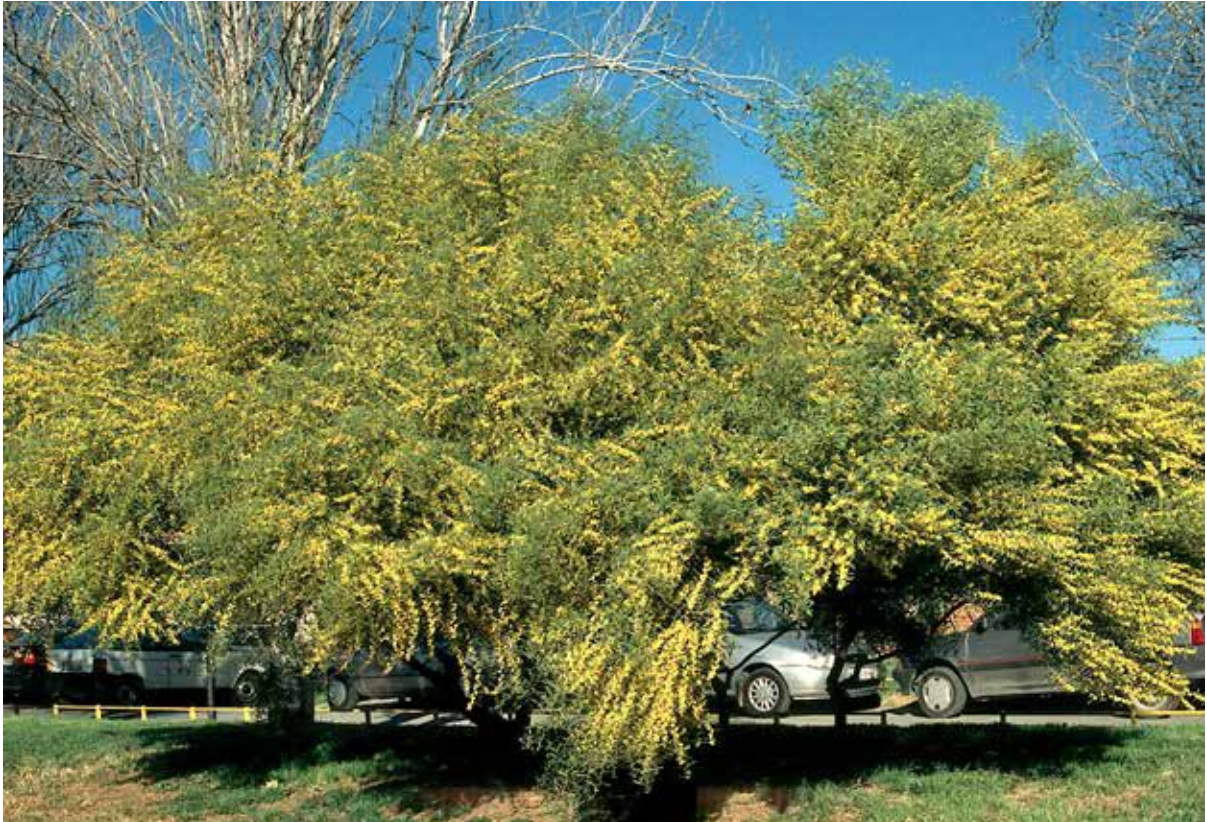
Acacia trineura en febrero de 2000. Los dos ejemplares daban color al jardín del Auditorio mientras la mayor parte del arbolado permanecía en parada invernal y sin vegetación.