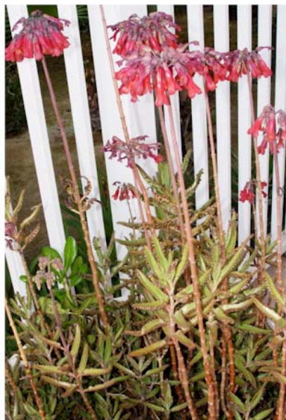
Kalanchoe x houghtonii