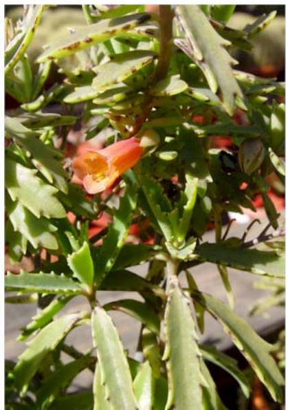
Kalanchoe x richaudii