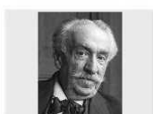
Gaston Eugene Marie Bonnier 1853-1922