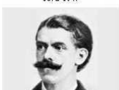
Georg August Schweinfurth 1836-1925