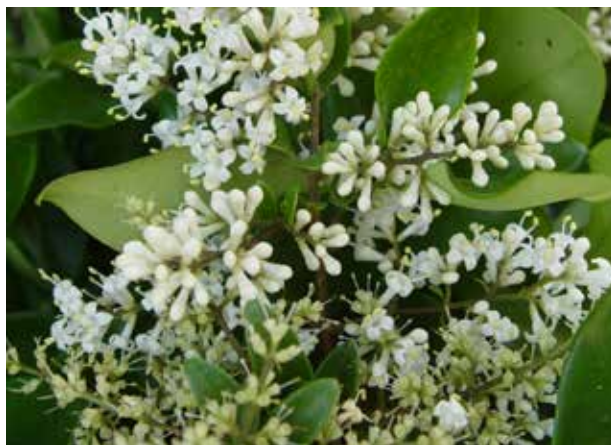
Ligustrum japonicum 'Texanum'

Especie rara vez cultivada y no vista en los viveros comerciales, a pesar de su interés ornamental. Zona 7 a 10.