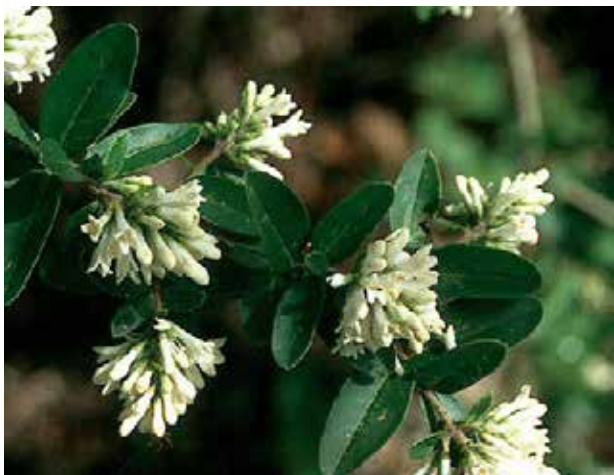
Ligustrum obtusifolium var. regelianum

Especie de hojas pequeñas que se utiliza con frecuencia en topiaria para formar figuras alambradas de lo más diverso, siendo por ello igualmente adecuada para borduras y setos recortados, así como para técnicas de bonsái. Zona 8 a 10