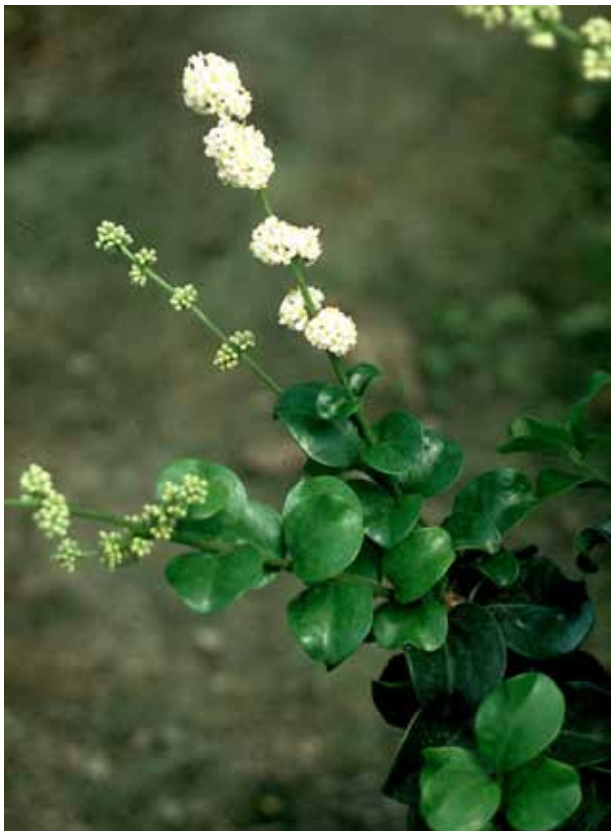
Ligustrum japonicum 'Rotundifolium'

Una de las variedades más extendida es 'Texanum', más denso y con hojas coriáceas de color verde oscuro; 'Rotundifolium' = L. coriaceum Nois., de porte más bajo y de crecimiento lento, compacto, con hojas de anchamente ovadas a redondeadas, coriáceas, de 3-6 cm de largo, de ápice obtuso o emarginado; 'Variegatum', con hojas de márgenes variegados. Zona 7 a 10.