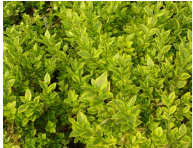
Ligustrum ovalifolium 'Aureum'

siciones soleadas sus hojas adquieren tonalidades doradas. Se obtuvo hacia 1920 en Aldenham House, Inglaterra, y honra al honorable Vicary T. Gibbs. ' Argenteum ', tiene las hojas marginadas de blanco. Zona 7 a 10.