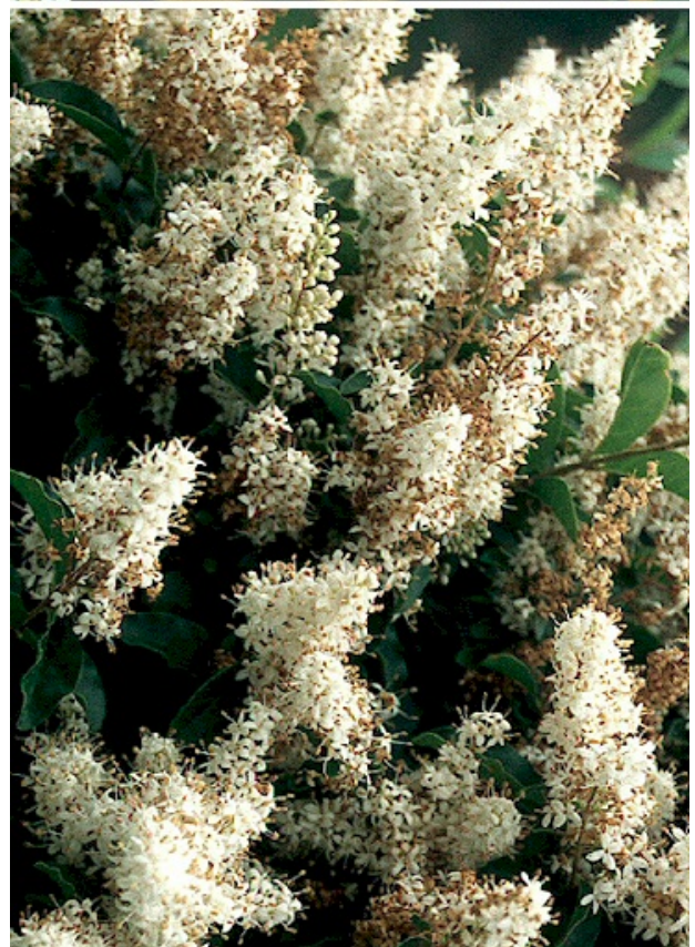
Ligustrum sinensis var. stauntonii y var. sinensis

9. L. henryi Hemsl. Journ. Linn. Soc. Bot. 26: 90 (1889)