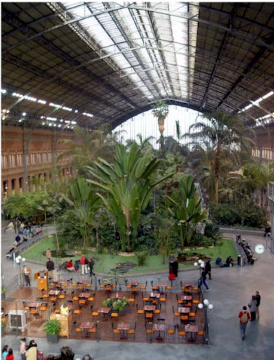
Estación de Atocha (Madrid)

También podían verse en las colecciones de algunos jardines botánicos otras especies, tales como Livistona australis (R.Br.) Mart., Sabal umbraculifera Mart., Trachycarpus martianus (Wall. ex Mart.) H. Wendl., Phoenix reclinata Jacq., Livistona rotundifolia (Lam.) Mart., Jubaea chilensis (Molina) Baill., Sabal palmetto (Walter) Lodd. ex Schult. & Schult.f., Rhapis excelsa (Thunb.) Henry, Hyophorbe indica Gaertn., Elaeis guineensis Jacq., Latania lontaroides (Gaertn.) H. E. Moore, etc.