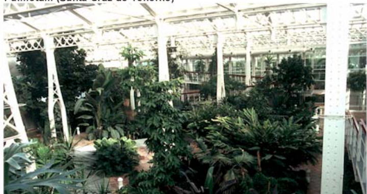
Palacio de Cristal de la Arganzuela (Madrid)