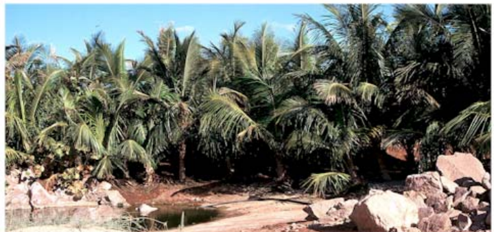
Palmetum (Santa Cruz de Tenerife)