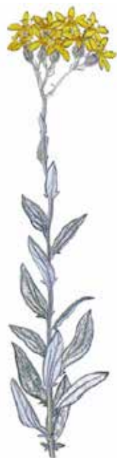
Ilustración de Senecio lineatus

nombre bajo el cual también aparecía relacionado en el "Catálogo de las plantas cultivadas en los jardines municipales", publicado en 1947 por Luis Riudor, Miguel Aldrufeu y Juan Pañella Bonastre (1916-1992), así como en las tres ediciones del ya clásico "Las plantas de jardín cultivadas en España", de Juan Pañella Bonastre, aparecidas, la primera en 1970, la segunda en 1980 y la tercera en 1991, un año antes de su fallecimiento.